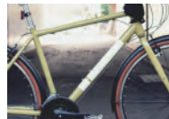
アクセントになる 「!」ステッカー