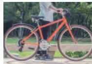
日本人に合わせた 独自のフレーム設計