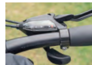
坂道も走りやすい 24段階 変速ギア

前3枚×後ろ8枚=24段階の変速ギアで登りも平地もラクラク走行！長距離のサイクリングでも快適です！