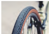
パンクに強い 太めのタイヤ

錆びにくく頑丈なアルミ素材のフレームは長持ちだから大学生活にピッタリ！卒業してからでもずっと乗り続けられます！