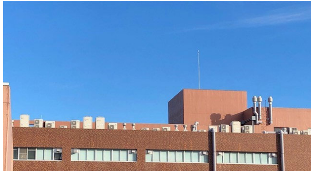
(青空に映える屋上の室外機)