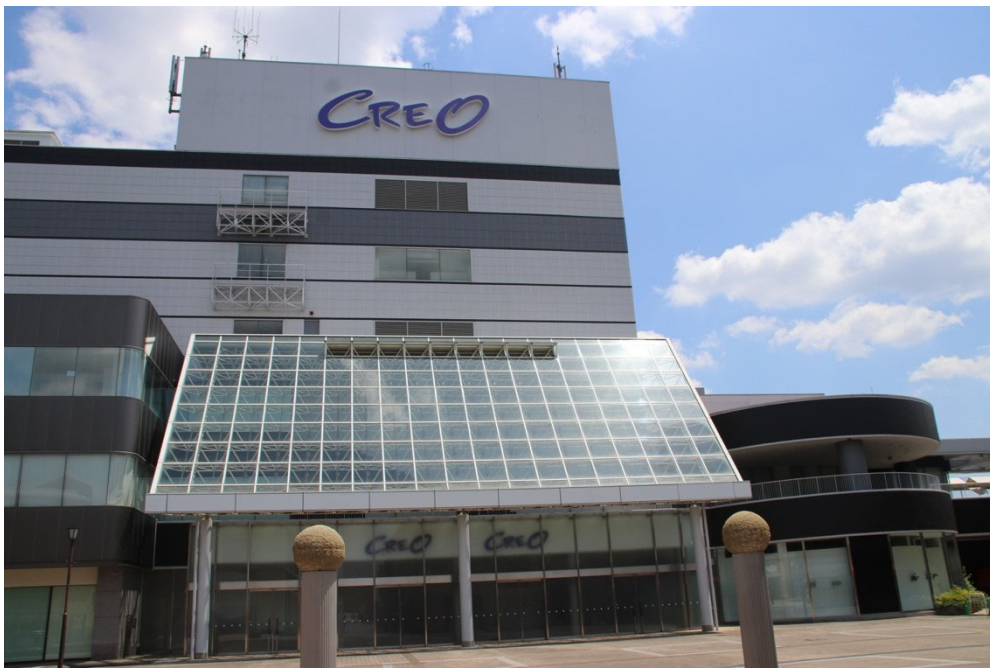
（つくば駅前のクレオ。左が旧西武側の建物、右の低層の建物が旧イオン側の建物。）

1985年、つくば万博の年に開業したクレオには、百貨店の西武とスーパーのジャスコ（現・イオン）が入居。ですが、駅からのアクセスの悪さなどで客足が遠のき、2017年には西武、昨年にはイオンなどが撤退。クレオは空きビルとなりました。