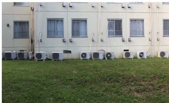
(草の上に並ぶ室外機)

そんな訳で、今回は大学構内の室外機をカメラに収め、彼らの存在に目を向けてみようと思います。