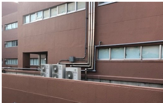
(室内機へ続くパイプも重要)

写真は他にもありますが、この辺りでやめておきます。気付いたのは、壁面に取り付けられた室外機は少なく、一階か、若しくは屋上に集中して置かれている、ということです。一階の室外機から各階にパイプが伸びていることもあり、一つの室外機で複数の部屋を管理できることも分かりました。