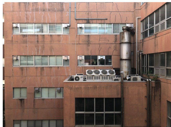
(建物の中腹にある室外機)