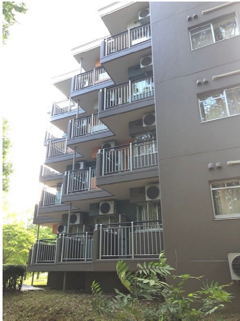
(各部屋に取り付けられた室外機)