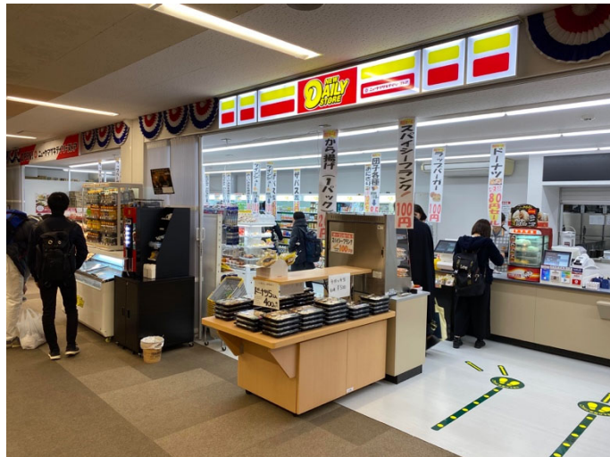
新たにオープンしたコンビニ

子、飲み物、雑貨などなど。友人の体育専門学群生に話を聞くと、「教室のそばにコンビニができ、キャンパスライフがとても快適になった」と絶賛していました。