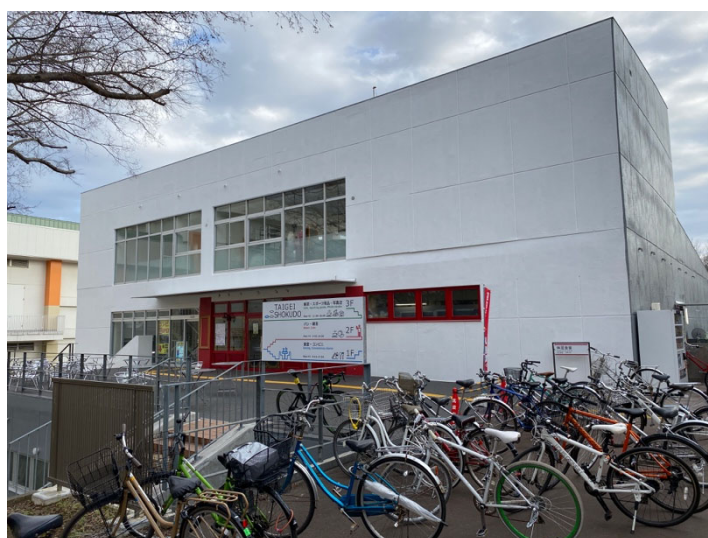
写真左：リニューアル前の体芸食堂、写真右：リニューアル後の体芸食堂

リニューアル後の体芸食堂は、特徴的だった「 DRINK FOOD ART 」という外壁のデザインはなくなってしまいました……。芸専らしい、秀逸なデザインの建物だなあと入学時から思っていた筆者からすると、少し残念です。