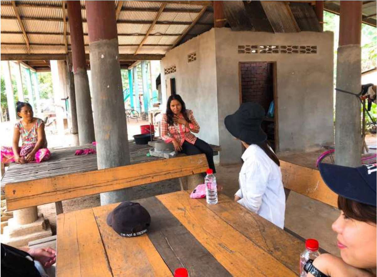
(トルタノンレッ村にて)