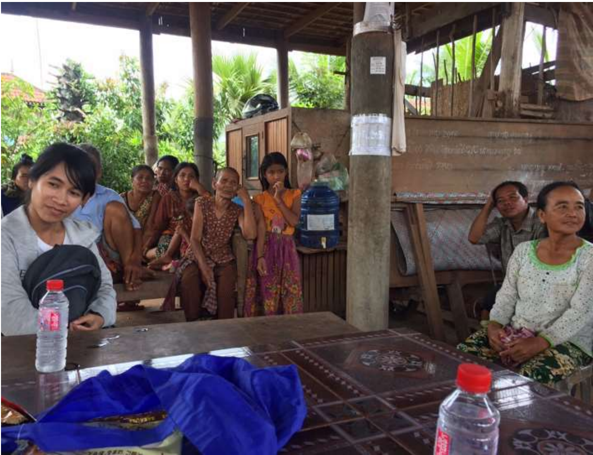
(タミン村 村長の家にて)