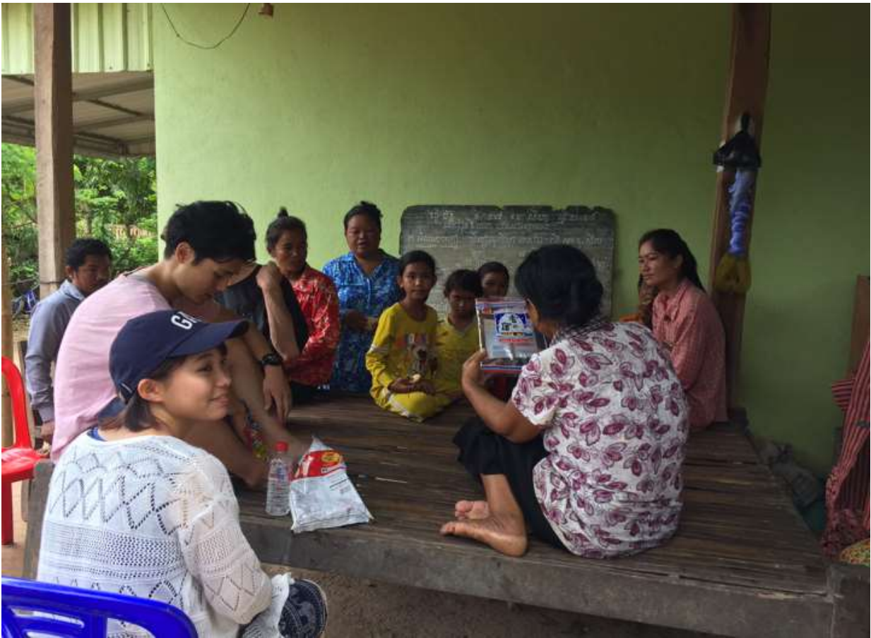
(トルタノンカウ村にて)