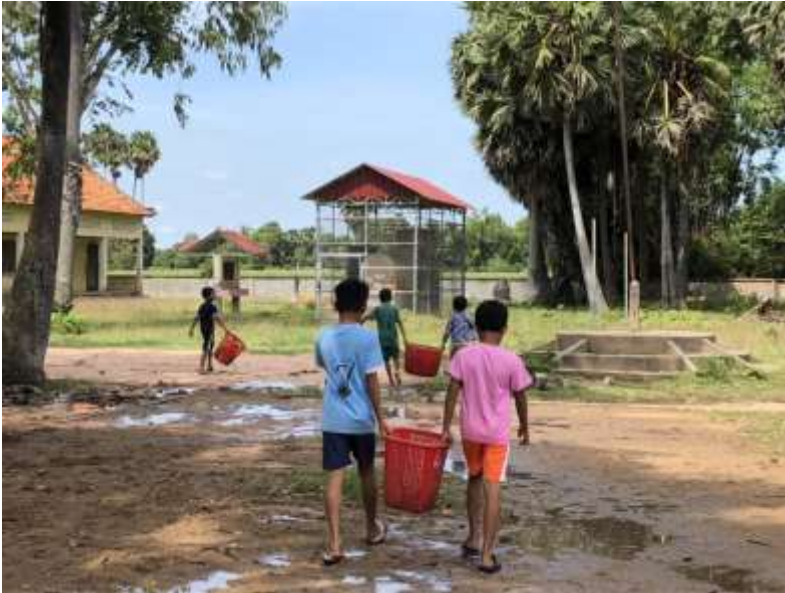
・水たまりの水を抜く